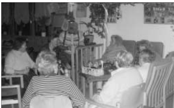
Dämmerschoppen im Haus Nagoldtal

Schnell verging die Zeit und zum Abschied wurde noch gemeinsam ein Gutenachtlied gesungen.