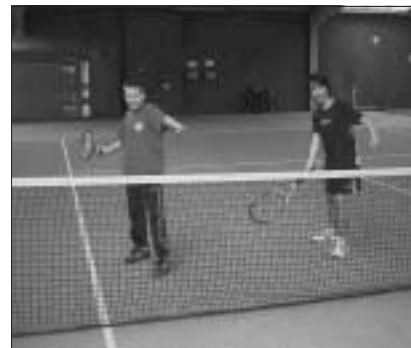
Wo bleibt der Ball ?