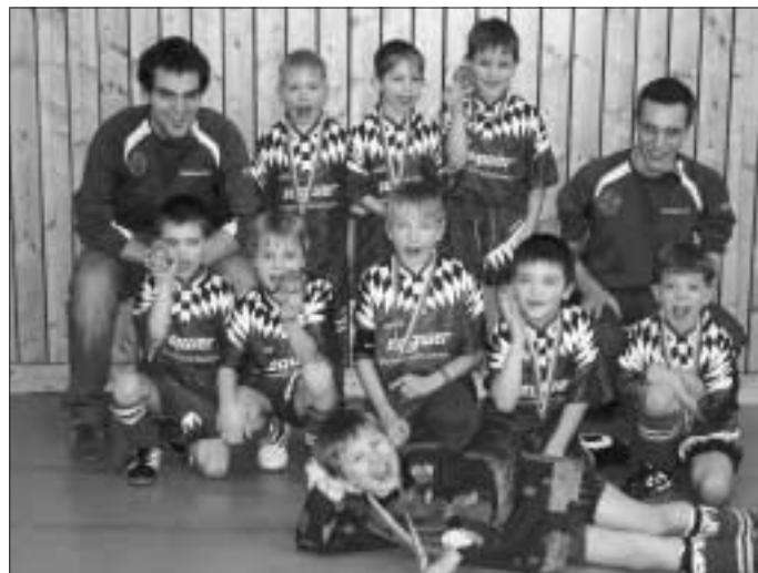
Unsere F2 beim Altburger Hallenturnier