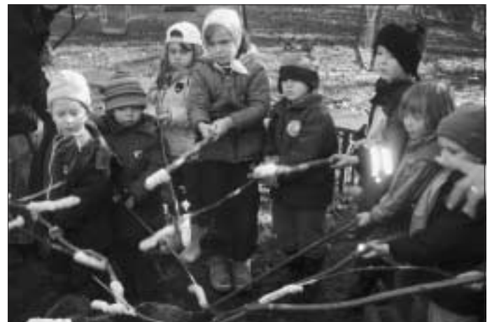
Ein gutes Essen gehört dazu

Wie bereits berichtet haben, sind die Kinder und die Erzieherinnen des Alzenberger Kindergartens mit der Zeitmaschine, der Earnie 8 auf Zeitreise. Vom Urknall zu den Dinosaurier..... bis in die Zukunft! Während der letzten Wochen war die Earnie 8 in der Steinzeit gelandet.