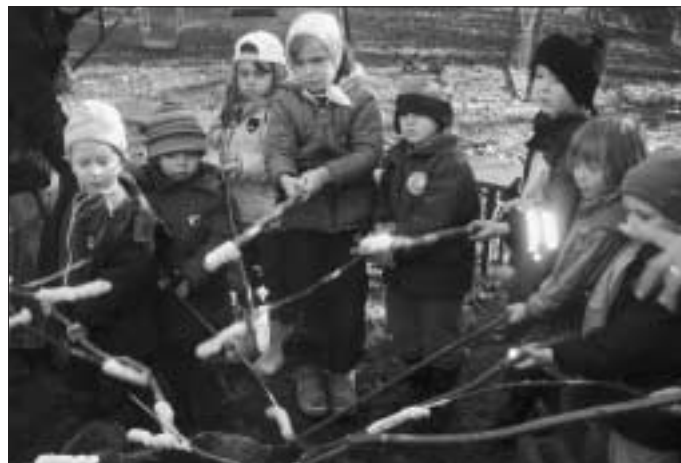
Ein gutes Essen gehört dazu

Wie bereits berichtet haben, sind die Kinder und die Erzieherinnen des Alzenberger Kindergartens mit der Zeitmaschine, der Earnie 8 auf Zeitreise. Vom Urknall zu den Dinosaurier..... bis in die Zukunft! Während der letzten Wochen war die Earnie 8 in der Steinzeit gelandet.