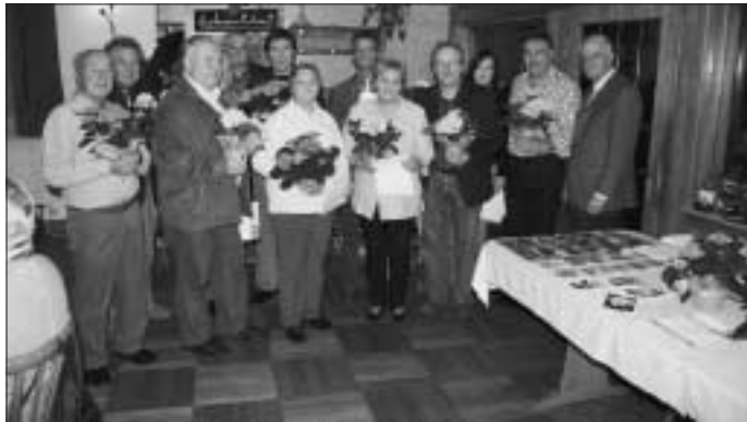
Ehrung bei der Hauptversammlung