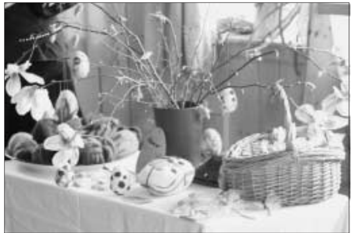
Reichlich Auswahl für den Osterhasen im Waldorfkindergarten

Weitere Informationen rund um den Waldorfkindergarten finden Sie auf unserer Homepage: www.waldorfkindergarten-calw.de .