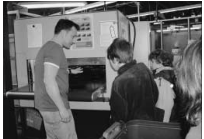
Interessiert lauschen die Kinder Erläuterungen zu einer Maschine, die Teile für die Automobilindustrie herstellt.

Informationen zur FESN über das Schulsekretariat unter Tel.: 07051/933880 oder unter www.fesn.de .