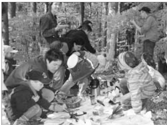
Festlich war die Tafel gedeckt für das Muttertagsfrühstück

Zu eben diesem waren in dieser Woche die Mütter der Wurzelkinder geladen. Eine wunderschön dekorierte, lange, weiße Tafel hatten die Kinder auf dem Waldboden mit selbst gemachten Dingen gedeckt. Müsli, Brötchen, Hefezopf und vieles mehr fand sich dafür jeden Geschmack etwas dabei! Nach gemeinsamem Lied und Frühstückritual durfte sich jeder bedienen und dann ein Plätzchen auf der Wiese in der herrlichen Sonne suchen. Nach dem Frühstück überreichten die Kinder ihre selbstgebastelten Frühlingboten: Wespen und Bienen, Schmetterlinge und Käfer kamen da zum Vorschein, die dekorativ auf hölzernen Schmuckdöschen saßen. Vielen Dank an das Waldteam und an die Wurzelkinder für dieses schöne Frühstück - wir Mütter kommen gerne mal wieder.