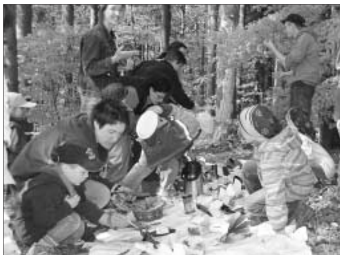
Festlich war die Tafel gedeckt für das Muttertagsfrühstück

Zu eben diesem waren in dieser Woche die Mütter der Wurzelkinder geladen. Eine wunderschön dekorierte, lange, weiße Tafel hatten die Kinder auf dem Waldboden mit selbst gemachten Dingen gedeckt. Müsli, Brötchen, Hefezopf und vieles mehr fand sich dafür jeden Geschmack etwas dabei! Nach gemeinsamem Lied und Frühstückritual durfte sich jeder bedienen und dann ein Plätzchen auf der Wiese in der herrlichen Sonne suchen. Nach dem Frühstück überreichten die Kinder ihre selbstgebastelten Frühlingboten: Wespen und Bienen, Schmetterlinge und Käfer kamen da zum Vorschein, die dekorativ auf hölzernen Schmuckdöschen saßen. Vielen Dank an das Waldteam und an die Wurzelkinder für dieses schöne Frühstück - wir Mütter kommen gerne mal wieder.