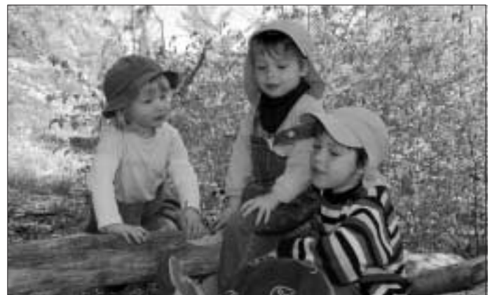
"Habt ihr schon gehört? Der Wurzelkinder Waldkindergarten feiert sein 10-jähriges Bestehen! Da feier' ich mit!"

Vielleicht haben wir Sie neugierig gemacht? Dann würden wir uns freuen, wenn Sie bei uns vorbeischaun und ein schönes Fest mit uns feiern.