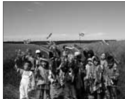
Auf dem Weg zum Johanni-Fest! Mit ihren "Feuerfackeln" ziehen die Kinder zum Johanni-Feuer.