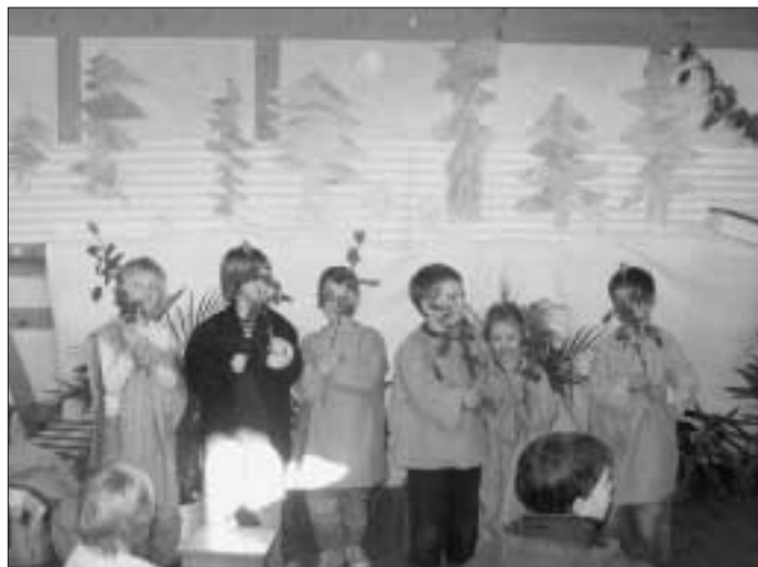
Die kleinen Schauspieler bei der Premiere

Informationen rund um den Waldorfkindergarten finden sie auf unserer Homepage: www.waldorfkindergarten-calw.de