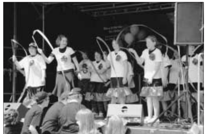
Tanzgruppe der Karl-Georg-Haldenwang-Schule

an alle, die zu dem gelungenen Fest am 3. Mai in Calw beigetragen haben.