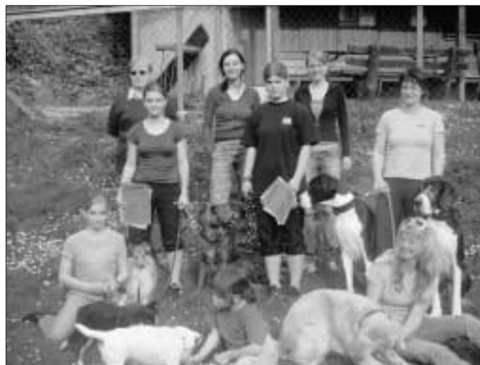
Unsere erfolgreichen Turnierhundesportler

Bei strahlendem Sonnenschein und herrlich blauem Himmel fand am letzten Sonntag auf dem Gelände des Vereins der Hundefreunde Calw das angekündigte Frühjahrsmeeting statt.