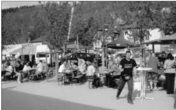
Calwer Messe 26. bis 27. April

Die Calwer Messe war wieder ein toller Erfolg. Bei herrlichem Frühlingsswetter konnte wir viele Gäste begrüßen.