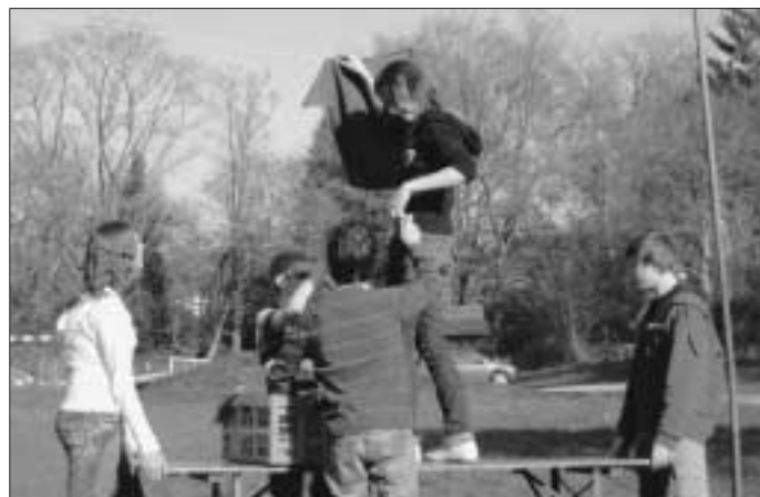
In einer Staffel wurden Jugendwerk T-Shirts um die Wette aufgehängt.

Zum Abschluss des Abends wurde der Film "Monsieur Ibrahim und die Blumen des Koran" angeschaut, dessen wichtigste Aussage war, dass man nur das behalten kann, was man verschenkt.