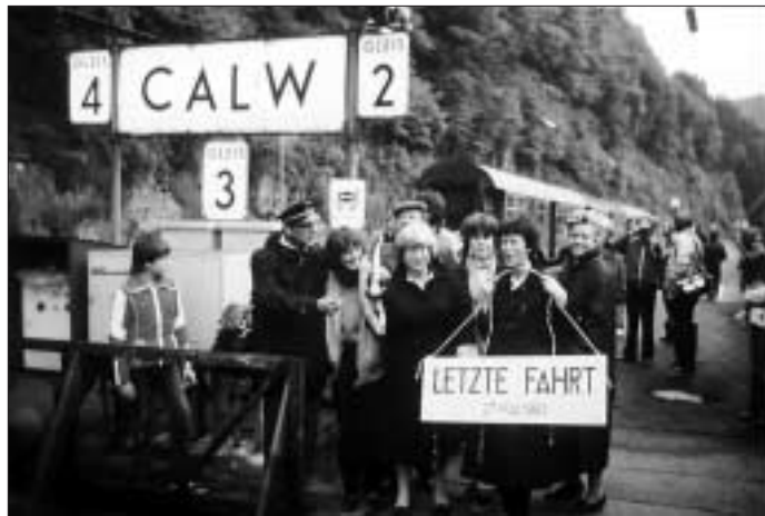
Freitagabend, 25. Mai 1983: Letzte Fahrt!