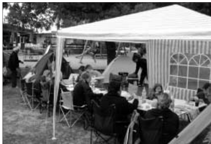
Zeltlager Fronleichnam Wochenende