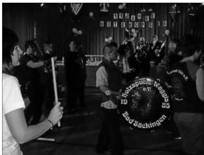
Rückblick Notehoper Rastatt 18. Oktober

Die Renovierungsarbeiten in unserem Vereinsheim sind in kürze fertig. Danach findet ein Einweihungsfest statt. Die Guggenprobe ist mittwochs ab 19.30 Uhr und die Tanzprobe ist samstags ab 16.30 Uhr im Vereinsheim. Das Vereinsheim befindet sich auf dem Wimberg im Spebharderweg gegenüber dem Edekamarkt. Neuinteressierte sind natürlich herzlich willkommen.