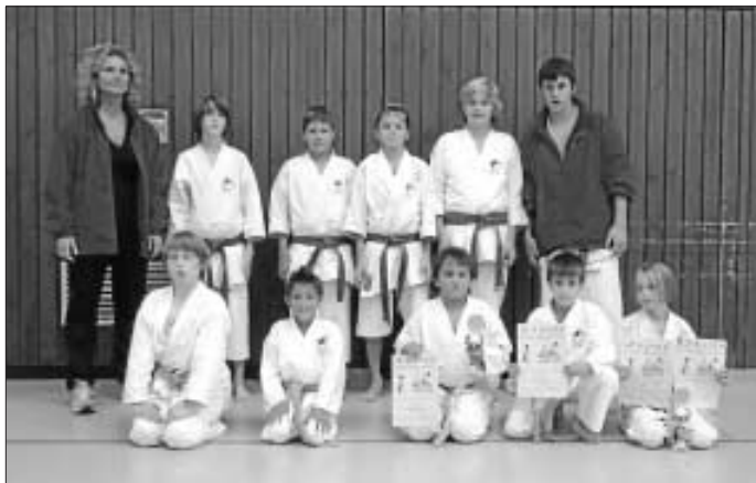
Das Team des JKA-Karate Dojo Calw e. V. Weitere Infos unter: www.jka-karate-calw.de