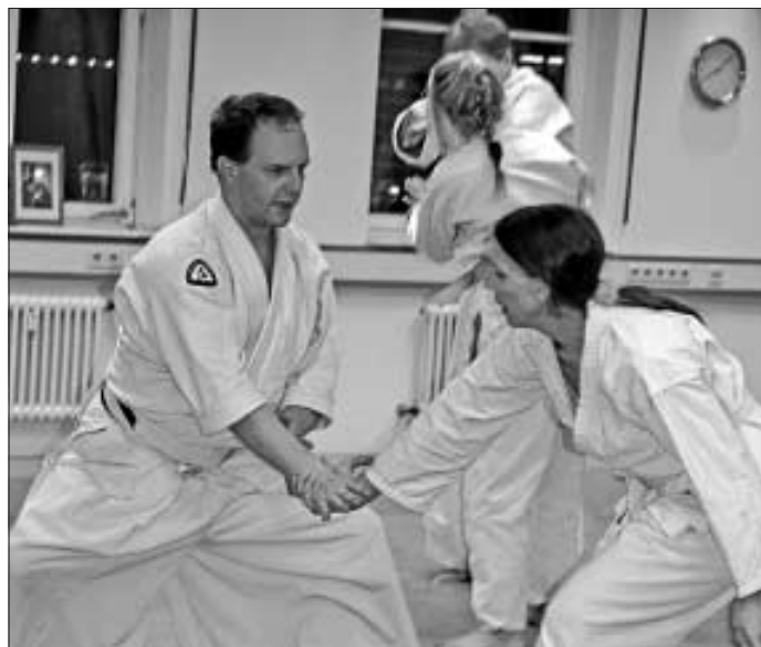
Aikido kennenlernen im Schnupperkurs ab 28. November