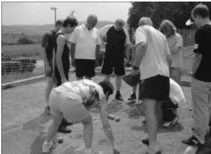
Wessen Kugel macht das Rennen ?