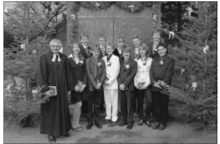
Konfirmandengruppe: Konfirmation in der Bernhardskirche am 13. April