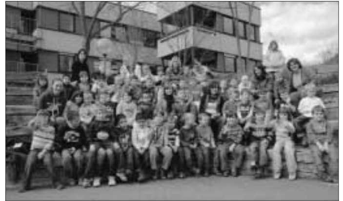
Mehr als 50 Kinder aus den vier Gruppen des Sprachheilkindergartens trafen sich im Frühjahr mit ihren Erzieherinnen in großer Runde.