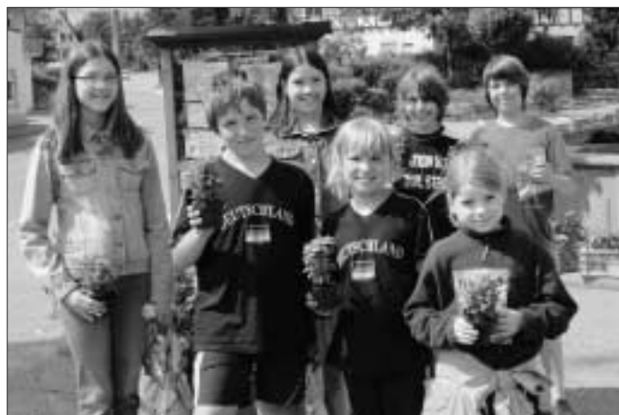
Kinderpflanzaktion rund um das Rathaus

Ein herzliches Dankeschön an die Kinder, die am Samstag unsere Blumentröge rund um die Rathauskreuzung bepflanzt haben. Die Blumen durften nach eigener Fantasie zusammengestellt werden und jeder Trog wurde zum Schluss mit einem Namensschild versehen. Wir hoffen nun auf ein gutes Gedeihen und eine so schöne Blumenpracht wie im letzten Jahr. Die Pflanzen spendete der Obst- und Gartenbauverein und betreute die Kinder während der Pflanzaktion. Von der Ortsverwaltung gab es als Dankeschön etwas Süßes und vom Verein ein Blumenpflänzchen.