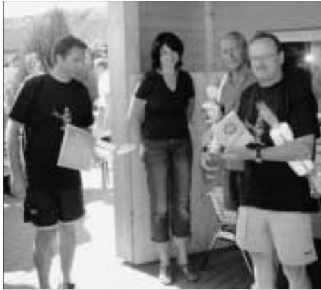
Jedermann kann Sieger sein!