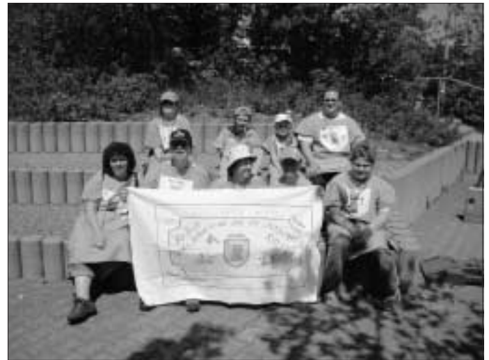
Die Altburger Teilnehmer mit ihrer selbstgebastelten Fahne.

Wie in jedem Jahr nahm die Kinder- und Jugendgruppe am Pfingstzeltlager des Trachtengau Schwarzwald teil. Dieses fand in diesem Jahr in Losburg statt. Bei heißem Wetter und ohne sorgen um ein nasses Zelt konnte auch ausgiebig gespielt werden. Gleich am Samstagabend fand auch eine Nachtwanderung statt. Am Sonntag, dem Besuchertag fand dann die alljährliche Lagerolympiade statt, wo die Gruppen an zehn verschiedenen Stationen Aufgaben erfüllen mussten, dabei ging es manchmal auch sehr nass daher. Abends ging es dann in die Disco. Am Montag gab es dann einen Gottesdienst. Nach dem Mittagessen fand noch ein Abschlusspiel statt, bevor die Zelte abgebaut wurden. Auf der Heimreise waren alle Kinder natürlich sehr müde.