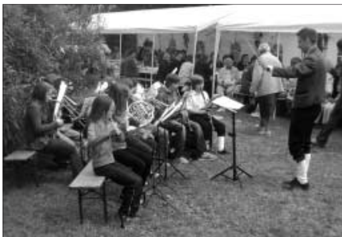
Die Jugendkapelle bei ihrem erst zweiten Auftritt.