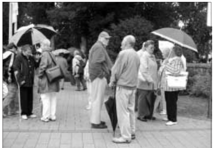
Müde aber gut gelaunt haben wir unseren Ausflug beendet, und freuen uns schon auf das nächste Mal.

Egal ob groß oder klein, es war für jeden etwas geboten, und wir wären sogar gerne noch länger geblieben. Auf der Heimfahrt gab es eine Kaffeepause in Bad Wimpfen und zum Abschluss ein Abendessen.