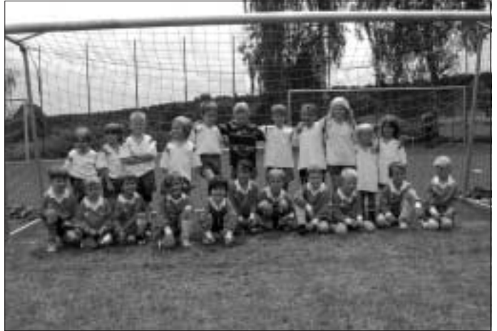
Die Bambinis des FC A/W und der SpVgg Bad T./Zavelstein

Der FC A/W bedankt sich recht herzlich bei allen Helfern, ohne die ein solches Turnier nicht möglich gewesen wäre.