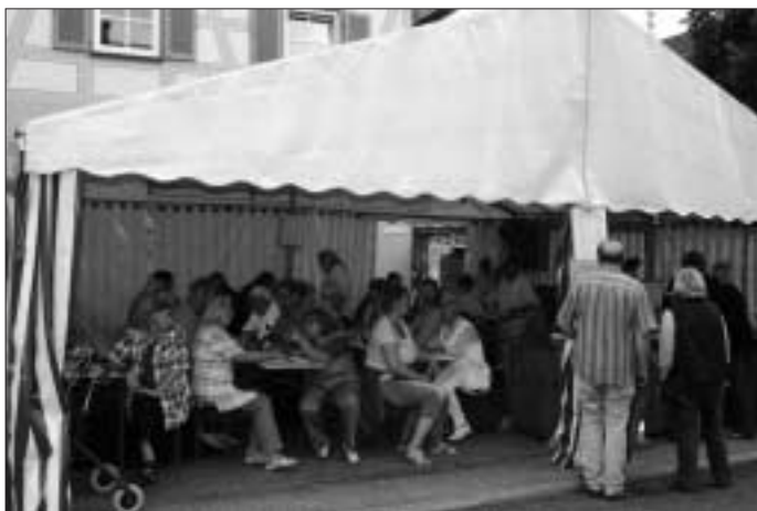
Man trifft sich beim Liederkranz

In diesem Jahr wollen wir unseren Sommerabschluss mit allen aktiven Sängerinnen und Sängern und Angehörigen bei einem Grillfest am Rehgrundbrünnele feiern. Dort werden wir an den neuen Sitzgarnituren gemütlich zusammen sitzen. Für Getränke ist gesorgt. Grillgut, Teller, Besteck, Gläser und eventuell einen Salat möchte bitte jeder selbst mitbringen - und natürlich gute Laune! Sollte Petrus uns einen Strich durch die Rechnung machen, treffen wir uns im Proberaum.