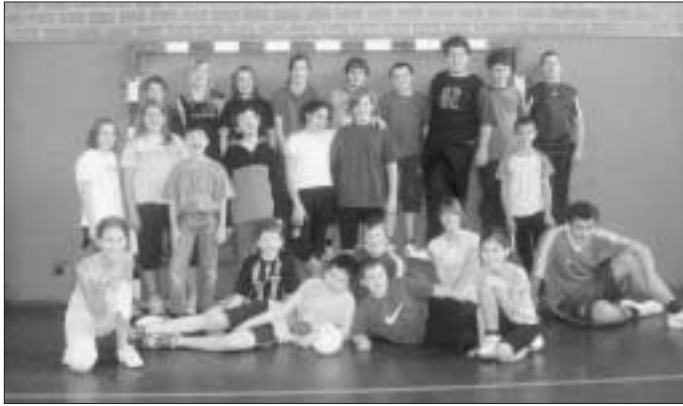
Teilnehmer der Handball AG