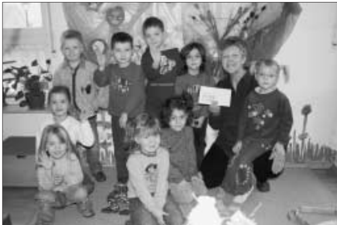
Bei den Kindern in der Widdumgasse war die Freude groß

Wir hatten angekündigt, dass der Reinerlös der Einnahmen beim "Singen unterm Weihnachtsbaum" unseren hiesigen Kindergärten und der Kernzeitenbetreuung zufließen soll. Alle Rechnungen