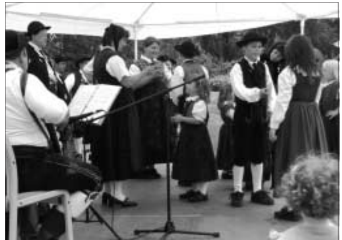
Die Kindergruppe in Aktion.

nächster Auftritt für alle, Samstag 30.08. beim Hahnentanz um 18.00 Uhr in Bad Teinach.