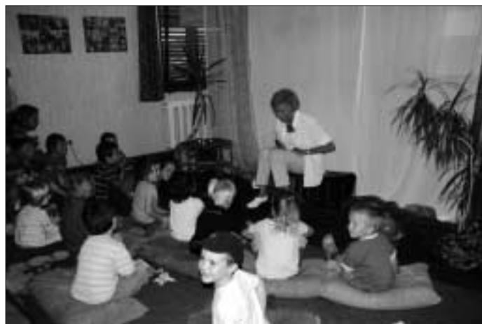
Märchenstunde bei "Kind & Kegel"