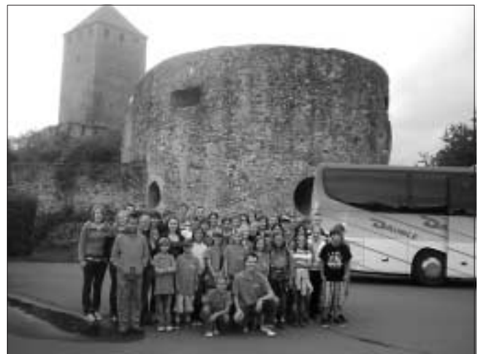
Die MV-Jugend vor der Burg Thallichtenberg.