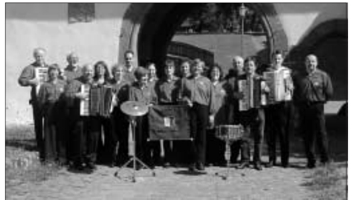
Das Akkordeon Orchester Hirsau

Konzert und Abendunterhaltung am Donnerstag 25. September in der AOK Klinik in Bad Liebenzell und am Sonntag 28. September Mitgestaltung der musikalischen Umrahmung bei den Einweihungsfeierlichkeiten des Kursales in Hirsau.