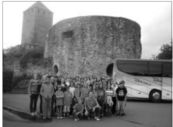
Die MV-Jugend vor der Burg Thallichtenberg.