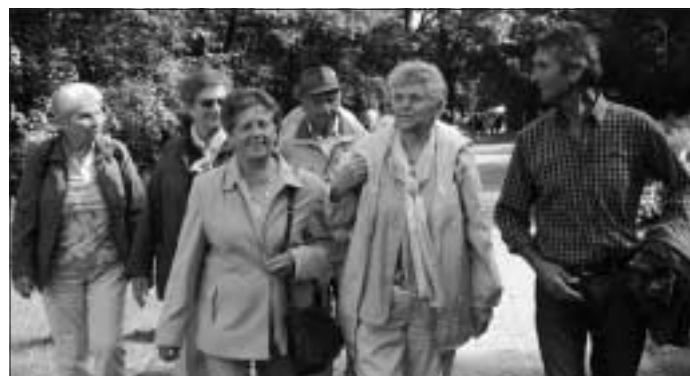
Rückblick Tagesausflug zur Landesgartenschau

Unser Tagesausflug nach Bad Rappenau letzten Sonntag war sehr schön und wir hatten Glück mit dem Wetter. Bad Rappenau ist bekannt durch sein Solevorkommen, aus dem noch bis 1973 Salz gewonnen wurde. Heute wird die Sole für Heilzwecke verwendet. Die Landesgartenschau erstreckt sich über 49 Hektar und hat 4000 qm Blumenfelder, dazwischen findet man immer wieder Kunstwerke und allerlei Gastronomie. Sie ist in drei Parks aufgeteilt.