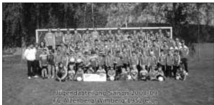
In neuen Trainingsanzügen präsentiert sich die FC A/W Jugend seit dieser Saison. Wir bedanken uns recht herzlich bei Abschleppdienst Busmann und Globus Sport Zwerenberg.

16.45 Uhr B-Jugend: FC A/W - SGM SV Bad Liebenzell