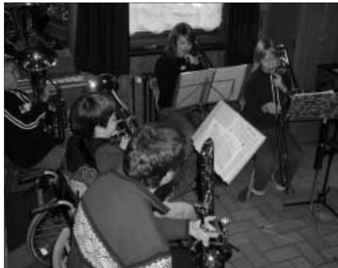
Altburger Nachwuchsmusiker stellen am 04. Oktober ihre Instrumente vor.