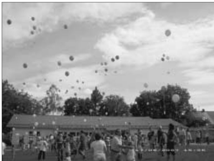
Ballonstart beim Stadtteilfest 2007