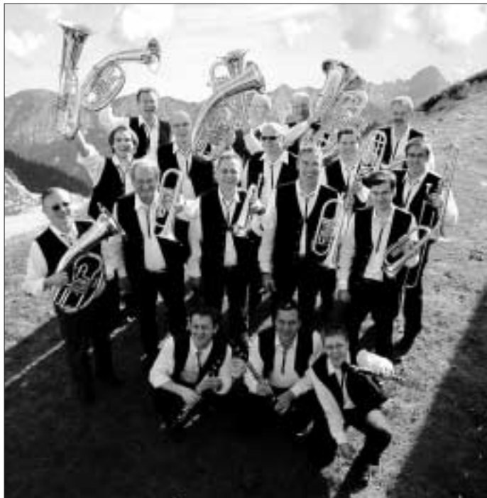
Die "Böhmische Musik Karlsbad" am 19. Oktober zu Gast bei der Altburger Musikerkirbe.

Am 18. und 19. Oktober veranstaltet die Trachtenkapelle Altburg ihr traditionelles Kirbe-Wochenende. In der Schwarzwaldhalle wird zwei Tage lang groß gefeiert. Egal ob traditionell oder modern - bei der Trachtenkapelle kommt jeder zum Zug.