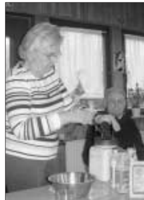
Butterherstellung wie zu Omas Zeiten