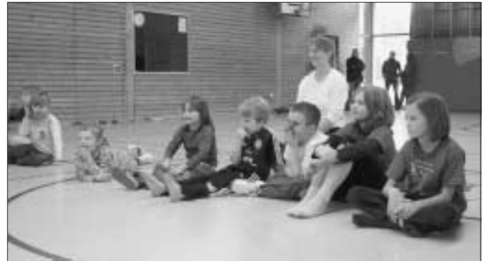
Kurze Verschnaufpause ...

Heute, am 8. Februar, fällt das Training aufgrund der Ferien aus.