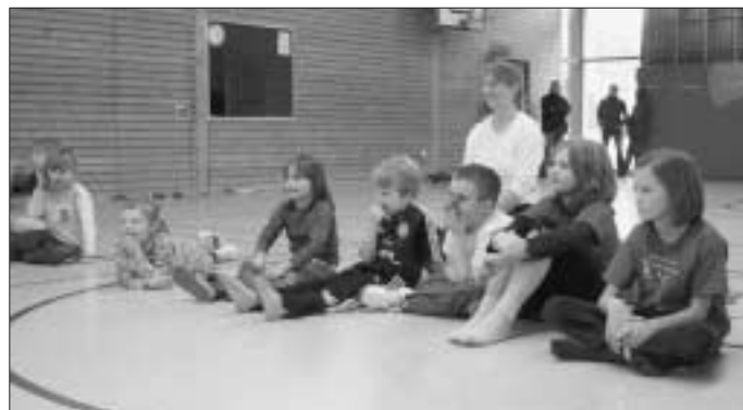
Kurze Verschnaufpause ...

Heute, am 8. Februar, fällt das Training aufgrund der Ferien aus.