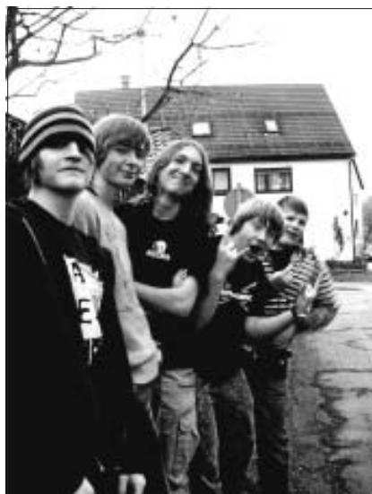
The Rebels aus Calw

für alle Metal-Freaks sind auch "Fateful Finality", die es richtig krachen lassen.