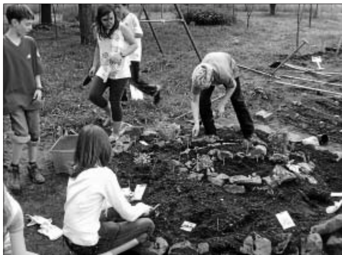
Schüler pflanzen die Kräuterspirale ein

wächshaus, das von ihm selbst gebaut worden war. Weitere Informationen zur FESN unter www.fesn.de oder Mail an info@fesn.de