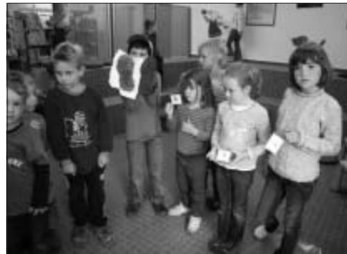
Einige Besucher mit ihren Fingerabdrücken und dem Abguss des Schuhprofils.

Über 20 Besucher fanden sich am vergangenen Montag wieder zur Vorlesestunde AbenteuerLeseland in der Calwer Stadtbibliothek ein. Leider spielte das Wetter nicht so mit, so dass der Abdruck eines Schuhprofils lieber in einer mit Erde gefüllten Plastikwanne genommen wurde. Auch über die Einzigartigkeit von Fingerabdrücken wurde gesprochen - ein junger Zuhörer wusste sogar, dass auch das menschliche Ohr einen unverwechselbaren Abdruck hinterlassen kann. Nach einer längeren Detektivgeschichte folgte dann eine kürzeren Erzählung, bei der die Kinder mitraten konnten, wer der Täter war und wodurch er sich verraten hatte. Zum Abschluss wurde von allen Kindern, die das wollten, ein Fingerabdruck abgenommen.