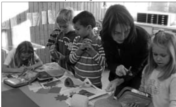
Mütter halfen tatkräftig mit

Nach diesem gelungenen Start in die vorweihnachtliche Zeit freuen sich alle auf die noch folgenden Aktionen der Grundschule Wimberg, die vom Plätzchen backen über das montägliche Adventssingen bis hin zur Grundschulweihnachtsfeier reichen. Und am letzten Schultag vor Weihnachten wird traditionell ein Gottesdienst zusammen mit der Hauptschule gefeiert.