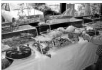
Da fällt die Entscheidung schwer - die Calwer Waldorfschule verkauft am Samstag selbstgebackene Kuchen.