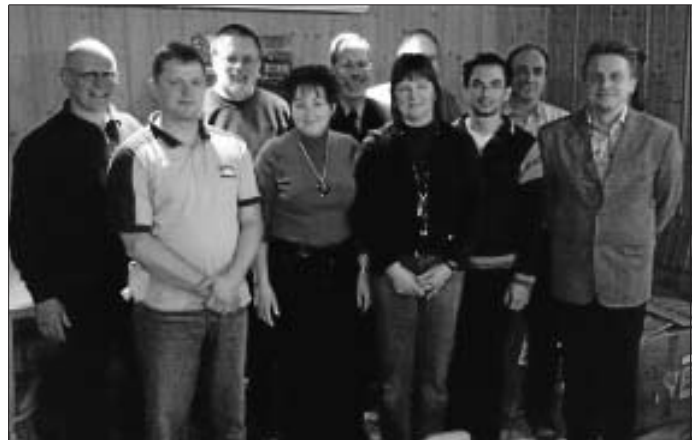
Vorstandschafft MSC- Calw