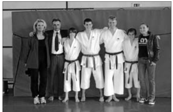
Das Calwer Dream-Team beim Donau-Cup in Donaueschingen