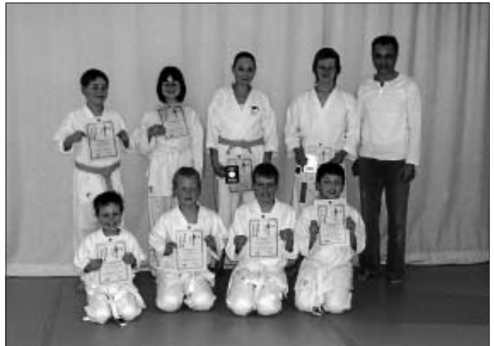
Erfolgreiche Prüfung beim JKA-Karate Dojo Calw e. V.

Wer dieses Mal nicht dabei sein konnte; die nächste Prüfung ist ca. Anfang-Mitte Juli.