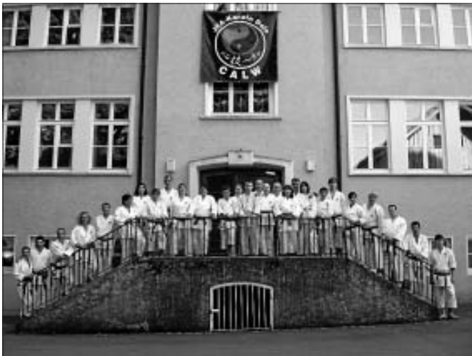
Calwer Karatekas in "ihrem" Haus beim 4-tägigen Lehrgang in Wangen im Allgäu

je 1,5 Stunden trainiert. Unter der Federführung von Bundestrainer Hideo Ochi gaben 5 weitere Top-Trainer aus Japan, Frankreich und Deutschland ihr Bestes, und motivierten wiederum die insgesamt über 700 Teilnehmer ihr Bestes zu geben. Durch die unterschiedlichen Trainingszeiten trafen sich die Calwer oft nur abends alle zusammen zum gemeinsamen Abendessen. Danach wurde dann die Gegend erkundet, das Festzelt aufgesucht oder der interne Skat Meister des JKA-Karate Dojo Calw ermittelt.