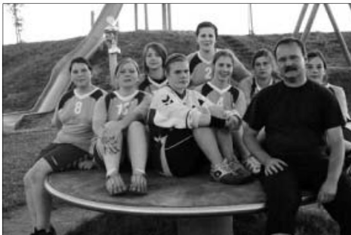
Weibliche B-Jugend belegte den 3. Platz beim Turnier in Reusten.

Unsere B-Jugend Mädchen spielten in der Hitze auf dem Kirchberg in Reusten ohne Auswechselspieler, dies kostete der Mannschaft sehr viel Kraft, was am Ende aber auch durch viel Erfolg belohnt wurde. Nämlich den 3. Platz von 10 Mannschaften. Das Turnier in Reusten war mit sehr guten Mannschaften besetzt. In unserer Gruppe mussten wir uns nur dem TSV Altensteig geschlagen geben und wurden verdient Gruppen Zweiter. Im Halbfinale spielten wir gegen den Gruppen Ersten der zweiten Gruppe, gegen WSG Eningen Pfullingen, dem späteren Turniersieger. Nach diesem spannenden Spiel gaben wir uns mit 3 Toren unterschied geschlagen. Im Spiel um den Platz drei traten die Mädchen der SG HCL um 20 Uhr gegen den TV Rottenburg an. Diese Mannschaft war ein direkter Vergleich, weil auch der TV Rottenburg in der Bezirksliga spielen wird und wir somit schon erfahren konnten was auf uns in der Hallenrunde zukommt. Ohne Auswechselspieler und verletzungsbedingter Unterzahl erkämpften sich die Mädchen einen tollen Sieg und einen verdienten 3. Platz.