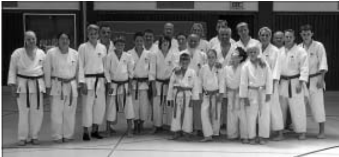
Der Bundestrainer mittendrin bei den Calwern