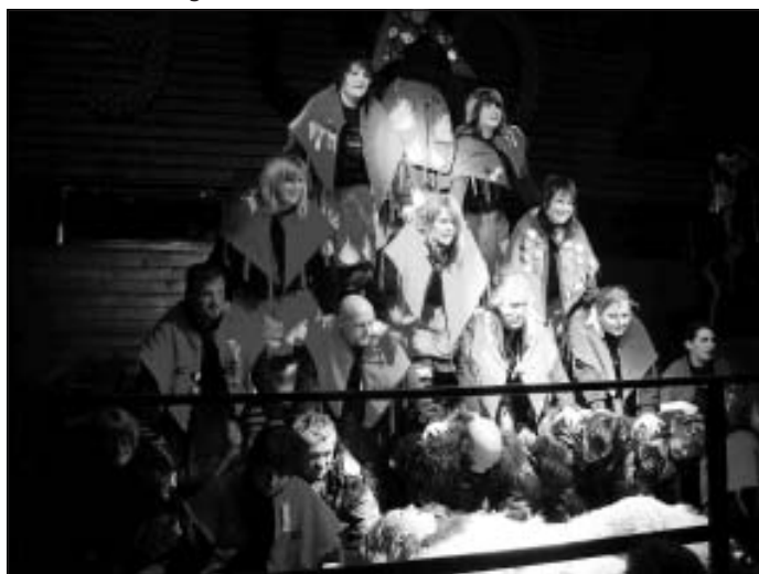
Auftritt bei Hexa Heuler