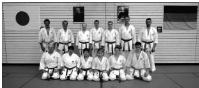
Die "Delegation" des JKA-Karate-Dojo Calw beim Bundestrainer-Lehrgang in Tamm

nutzte diese Gelegenheit, neben dem schweißtreibendem Training auch alte Freundschaften wieder aufzufrischen.