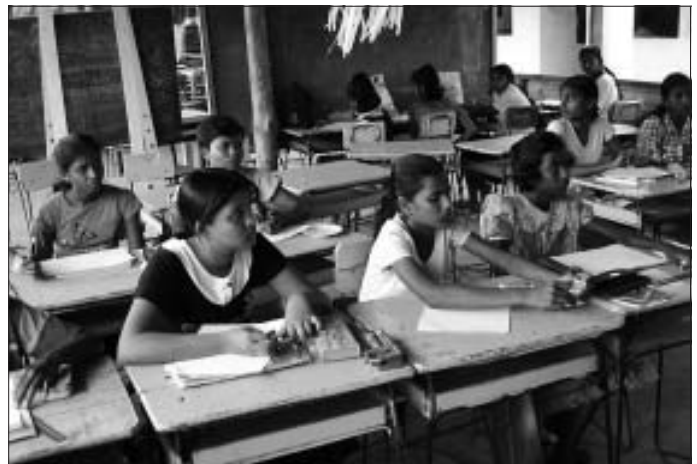
Schülerinnen und Schüler unseres Jugendclubs in Hikkaduwa

Beim gemeinsamen Kaffee- (und natürlich echtem Sri Lanka Tee) trinken wurden Fotos und Briefe aus Sri Lanka verteilt, die jeder anschließend mit nach Hause nehmen konnte. Auch die Patenfamilien, deren Anwesenheit nicht möglich war, haben ihre Briefe inzwischen per Post erhalten.