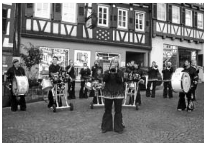
Auftritt Verkaufsoffener Feiertag

Weitere Infos unter : 07051 966523 ab 17.30 Uhr