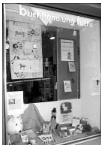
Gestaltet mit Arbeiten der Kinder und Jugendpsychiatrie Calw.

Am kommenden Samstag, den 10.10. finden bundesweit Aktionen zum "Tag der seelischen Gesundheit" statt. Der Förderverein KiJuPsychCalw e.V präsentiert sich in diesem Rahmen mit einem Waffelverkauf und Infostand von 10 bis 13 Uhr auf dem Marktplatz in Calw.