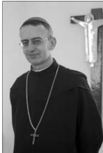
Einsiedler Abt am 21.10.2009 zu Gast beim Dialog in St. Aurelius