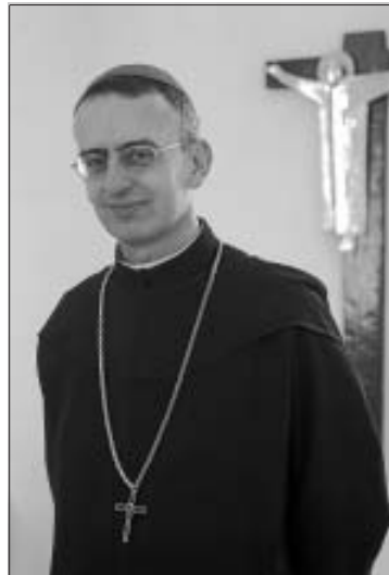
Einsiedler Abt am 21.10.2009 zu Gast beim Dialog in St. Aurelius