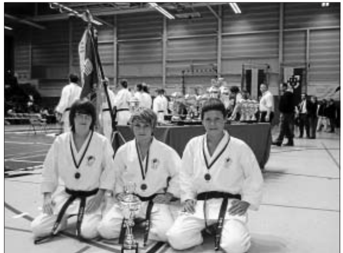
Zum ersten Mal in Calw- der begehrteste Pott der Deutschen Karateszene, der JKA-Cup