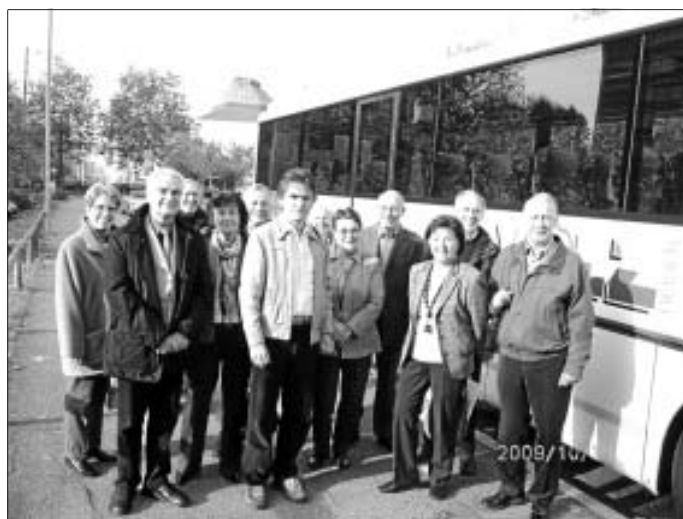
Teilnehmer von Haus & Grund Calw