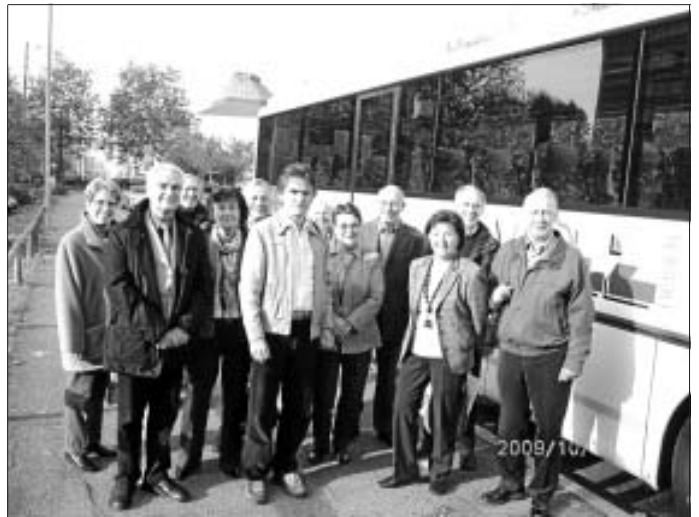
Teilnehmer von Haus & Grund Calw