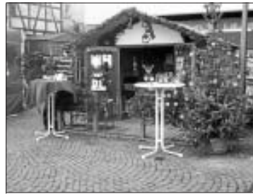
Stand des FAC

Ein freundlich gesinnter Wettergott bescherte den Aktiven des FAC ein deutliches Plus der Besucherzahlen, was sich im rechnerischen Ergebnis des Verkaufs niederschlug. Natürlich stand die Nachfrage nach nahrhaften Naturalien deutlich im Vordergrund, während wärmende Textilien ein geringeres Interesse fanden. Alles in allem waren die Betreuer/innen des Standes ebenso zufrieden wie die zahlreichen dienstbaren Geister, denen die Herstellung der Weihnachtsbrötchen, Lebkuchen, Marmeladen, Figuren usw. oblag.