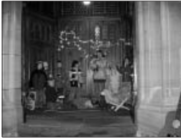
Die "Kirchenmäuse" stellen die Szene im Stall von Bethlehem dar.