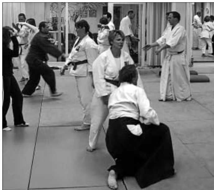
Ab 6. März neuer Schnupperkurs beim Aikido-Club Calw

Lust auf Bewegung nach den tollen Tagen? Ab 6. März, 19 Uhr, bietet der Aikido-Club Calw einen neuen Schnupperkurs für Einsteiger und Wiedereinsteiger an. Aikido ist eine moderne Kunst der Selbstverteidigung, der Techniken aus den traditionellen Kampfkünsten der Samurai entwickelt wurden. Die aggressive Kraft des Angriffs wird geführt, umgelenkt und durch eigene Energie verstärkt auf den Angreifer zurückgeführt. Aikido wird im harmonischen Miteinander geübt: zum Beispiel mit gezielter Körper-schulung, meditativen Elementen, Konzentrations-, Atem- und Fallübungen. Der Schnupperkurs richtet sich an Jugendliche ab 14 und Erwachsene, umfasst fünf Abende und kostet 30 Euro. Bitte bequeme Kleidung mitbringen. Ort: tanzraum in der Bischofstraße 65 in Calw. Leitung: Bernd Kappler und das Trainingsteam des Aikido-Clubs Calw. Weitere Infos beim 1. Vorsitzenden Jochen Genthner, Telefon 0172 7237298, www.aikido.tanzraumcalw.de .