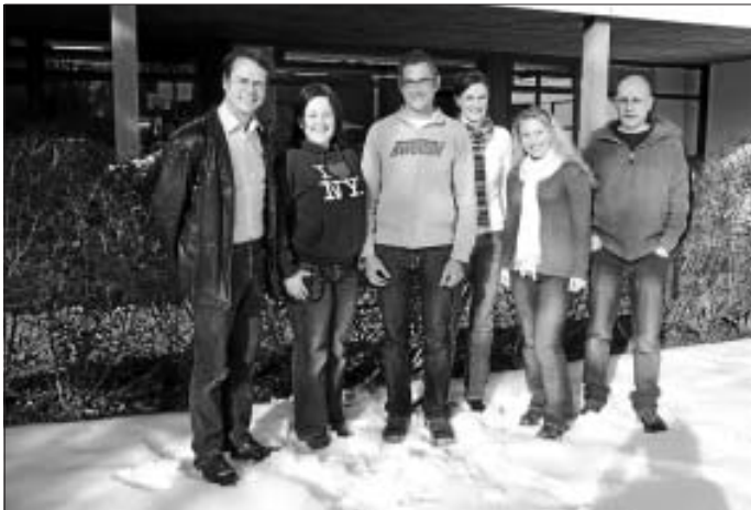
Der neue Vorstand des Förderverein Kinder und Jugendpsychiatrie Calw e.V

Der Förderverein KiJuPsych Calw e.V hat seine Vorstandschaft neu aufgestellt und ehemalige, nicht mehr zur Wahl stehende Mitglieder des Vorstandes, verabschiedet. Bei der Mitgliederversammlung am 19. Februar wurden alle Vorstandsposten zur Wahl gestellt. Zahlreiche Mitglieder stellten sich zur Verfügung und der neue Vorstand setzt sich aus folgenden Personen zusammen: