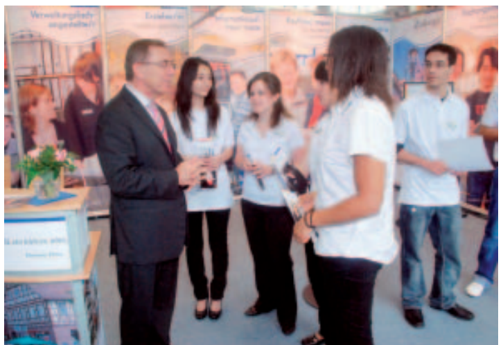
Landrat Köblitz im Gespräch mit den Azubis der Stadt Calw

tor, Schulen und Weiterbildungsträgern. Ergänzend zum Einblick in die verschiedenen Berufs- und Ausbildungssparten referierte Thomas Butsch, Ausbildungsleiter bei der Daimler AG über die Einstellungsverfahren des größten deutschen Autoherstellers; passend dazu bot die Berufliche Bildung gGmbH BBQ einen kostenlosen Bewerbungsmappen-Check an.