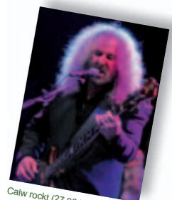
Calw rockt (27.06.)