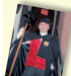
Nachtwächterrundgang – Calw zum Fürchten? (9. & 16.10.)