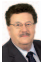
Direkt in den Bundestag gewählt: Hans-Joachim Fuchtel, der in Calw 41,4 Prozent der Erststimmen erhielt

12,4 Prozent der Stimmen (1299) können die Grünen für sich verbuchen, die sich in Calw um 2,7 Prozentpunkte verbessert haben. 1094 Wähler entschieden sich für Kandidatin Dr. Charlotte Michel-Biegel und verhalfen ihr damit zu rund elf Prozent. Es folgt die Linke mit 7,5 Prozent, deren Bewerber Franz Groll aus Gechingen auf 7,8 Prozent der Erststimmen kommt.