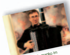
Konzert Viktor Romanko im Landratsamt Calw (14.10.)

Ein Rundgang durch das Kloster, die große Peter und Paulskirche, den benachbarten Mönchsfriedhof und die intakte Marienkapelle. Beim Spazieren durch den Kreuzgang erklingen gregorianische Gesänge und lassen stimmungsvoll das Leben im Kloster erahnen. Dauer: 1,5 Stunden. Preise: 4,50 Euro, ermäßigt 3 Euro.