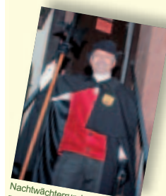
Nachtwächterrundgang – Calw zum Fürchten? (9. & 16.10.)