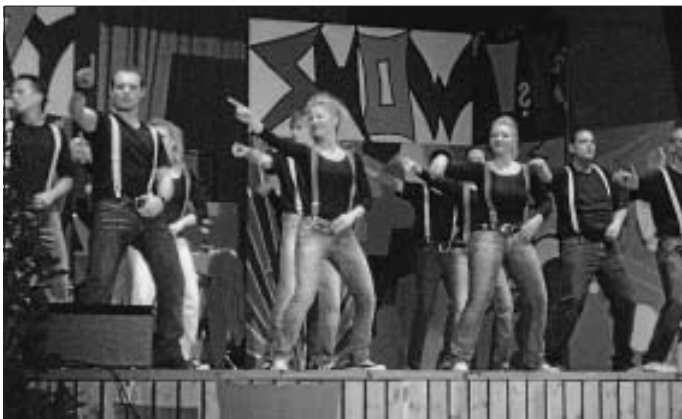
"Crazy Show" vom Musical-Ensemble Bad Teinach