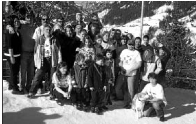
Handballer on Tour 2009

Zum 3. Mal fand nun die Familien-Skifreizeit der Handballabteilung statt. Nach zwei Jahren in Tschechien, entschied man sich in diesem Jahr für ein kleines, familienfreundliches Skigebiet in der Schweiz. Tolle Schneeverhältnisse und ein super Wetter erwarteten uns im Diemtigtal im Berner Oberland. Mit 20 km Pisten, modernen Anlagen und preiswerten Tarifen war das für unsere Gruppe mit 17 Kindern u. Jugendlichen sowie 18 Erwachsenen einfach optimal. Unser Selbstversorgerhaus lag direkt an der Skipiste, so dass die Kinder jederzeit eine Verschnaufpause einlegen konnten. Die Skischule in unmittelbarer Nähe war das Ziel unserer Zwerge. Sie waren so eifrig dabei, dass sie im Abschlussrennen auch gleich die Plätze 1-4 abräumten. Herzlichen Glückwunsch nochmal zu euren tollen Medaillen!