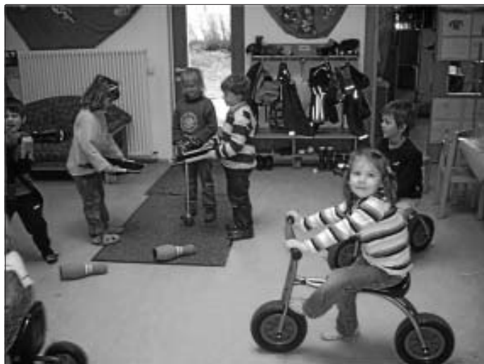
Auf zum Kuchenbuffet!

Essen Sie also für den guten Zweck ruhig ein Stückchen Kuchen mehr. Die Kinder werden die Kalorien liebend gerne in Bewegung umsetzen.