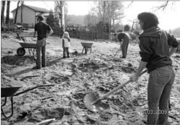
Arbeitseinsatz bei "Kind & Kegel"

Am 21. Mai (Himmelfahrt) besucht der Förderverein das Musical "We will rock you" in Stuttgart. Nähere Infos und Karten gibt es bei A. Zündel, Tel. 6546.