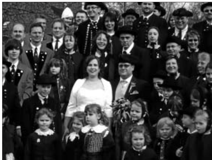
Das Brautpaar im Kreise aller Musiker und Trachtler

Anschließend fuhr die Festgesellschaft nach Langenbrand und feierte bis zum frühen Morgen ein rauschendes Hochzeitsfest.