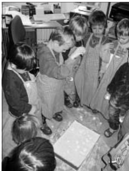
Simulation von Meteoriteneinschlägen "im Labor"