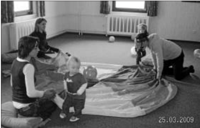
Mini - WeSpEn in Aktion

Am morgigen Samstag, 4. April steht wieder ein neuer Arbeitseinsatz auf dem neuen Spielplatz an. Alle großen und kleinen Helfer treffen sich um 10 Uhr mit Schubkarren und Schaufeln. Der neue Sand soll unter den neuen Spielgeräten verteilt werden.