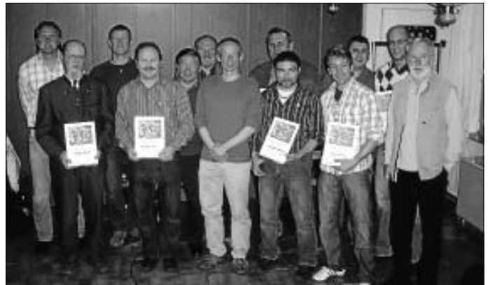
Das Rückrat unseres Vereins. Langjährige Mitglieder+Spieler, fleißige Helfer und die frisch gewählten Mitglieder der Vorstandschaft