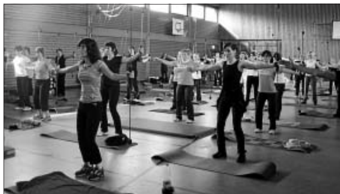
Teilnehmerinnen der Aerobic Convention beim Workout mit dem Flexibar