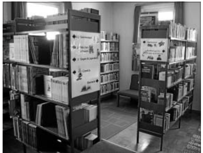
Die Ortsbücherei Altburg in neuem Glanz

Wir hoffen, dass nun möglichst viele Altburger von dem neuen Angebot Gebrauch machen und so Mancher vielleicht seine "alte" Ortsbücherei neu für sich entdeckt.