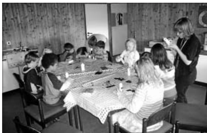
Da im Mittelalter Kerzen für die Beleuchtung sorgten, wurden in einer Gruppe Kerzen verziert

Am vergangenen Sonntag feierte die gesamte Gemeinde zum Abschluss der Kibiwo einen Gottesdienst. Das Kibiwo-Team und Pfarrer Fetzer hatten diesen gemeinsam vorbereitet. Nach dem Gottesdienst fand bei schönem Wetter ein buntes Treiben auf dem Kirchplatz statt. Eine Gruppe von Kindern führte einen mittelalterlichen Reigen auf. Nochmals ein riesiges Dankeschön an alle Mitarbeitenden für ihren unermüdlichen Einsatz.