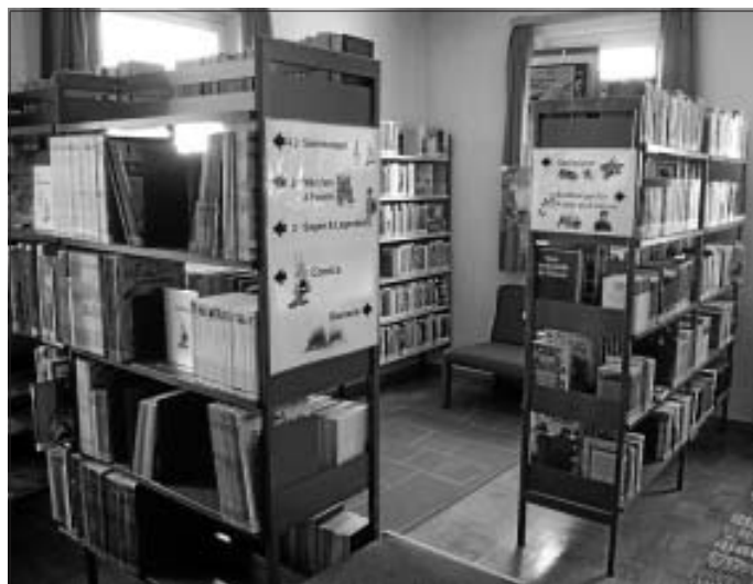
Die Ortsbücherei Altburg in neuem Glanz

Wir hoffen, dass nun möglichst viele Altburger von dem neuen Angebot Gebrauch machen und so Mancher vielleicht seine "alte" Ortsbücherei neu für sich entdeckt.