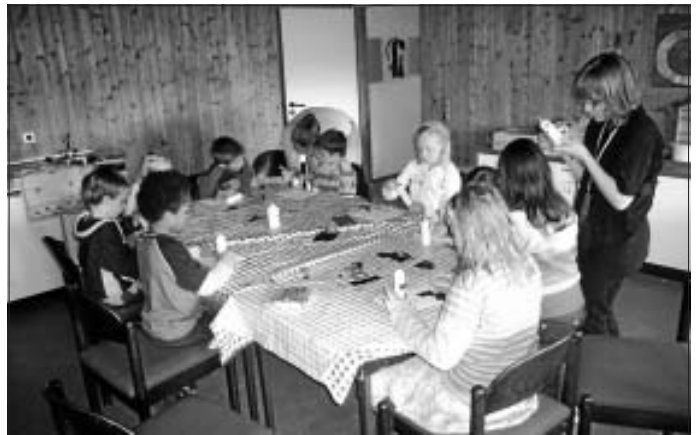
Da im Mittelalter Kerzen für die Beleuchtung sorgten, wurden in einer Gruppe Kerzen verziert

Am vergangenen Sonntag feierte die gesamte Gemeinde zum Abschluss der Kibiwo einen Gottesdienst. Das Kibiwo-Team und Pfarrer Fetzer hatten diesen gemeinsam vorbereitet. Nach dem Gottesdienst fand bei schönem Wetter ein buntes Treiben auf dem Kirchplatz statt. Eine Gruppe von Kindern führte einen mittelalterlichen Reigen auf. Nochmals ein riesiges Dankeschön an alle Mitarbeitenden für ihren unermüdlichen Einsatz.