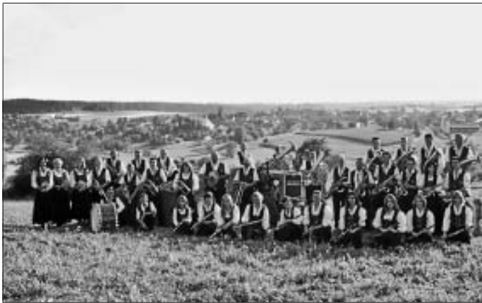
Musikverein Egenhausen zu Gast bei der Trachtenkapelle Altburg.

Auf Ihren Besuch freut sich die Trachtenkapelle Altburg!